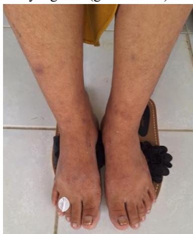
1.c. Ekstremitas Inferior: Tampak patch hipopigmentasi pada tungkai bawah; pada pemeriksaan fisik ditemukan adanya gangguan sensorik pada area lesi tersebut.