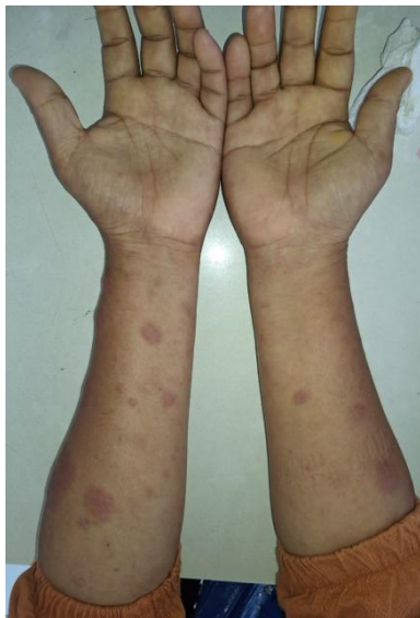
Gambar 1.b. Ekstremitas Superior: Lesi hipopigmentasi multipel yang tersebar pada lengan atas dan bawah, menunjukkan distribusi yang luas (generalisata).