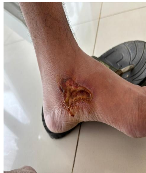
2.c. Ekstremitas Inferior: Lesi hipopigmentasi pada area tungkai bawah; pemeriksaan fisik pada area ini menunjukkan adanya anestesia (mati rasa) terhadap rangsang suhu dan sentuh.